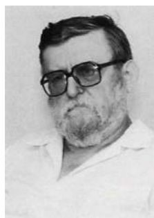
Obr. 1 Lubomír Feldek